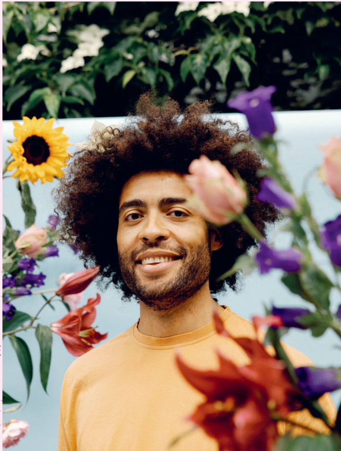
R&F NJOTEA ↓